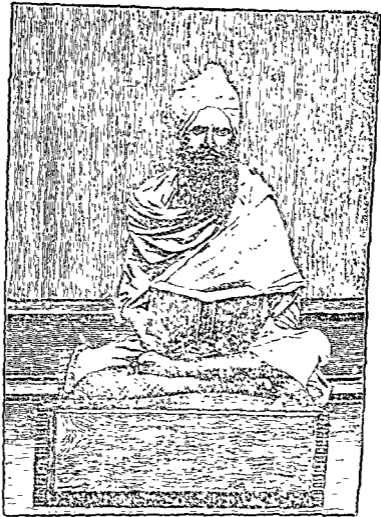
काशीनिवासिनिर्मल पं० स्वामिश्रीगोविन्द सिंहसा धुः